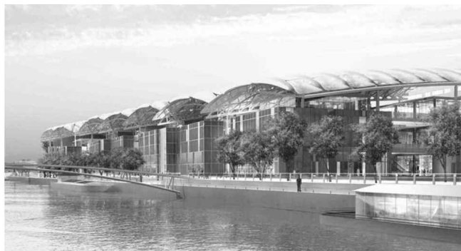
Photo 1. Des exemples de réalisation : Aqua Mundo à Attigny (Central Park), ou Lyon Confluence (pôle loisirs de 22 000 m 2 ) ci-contre.

Les fibres, tissus, et autres composants textiles sont de plus en plus appelés à remplacer les matériaux traditionnels pour des applications architecturales. Solides, résistantes et légères, les structures et constructions textiles peuvent être montées en peu de temps et couvrir facilement un grand espace. L'utilisation de la toile translucide réfléchissant le soleil permet de minimiser l'usage d'éclairage électrique à l'intérieur du bâtiment. Les tissus photovoltaïques ou réfléchissants présentent un intérêt pour capter l'énergie nécessaire au fonctionnement du bâtiment.